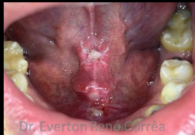
Após 1 semana