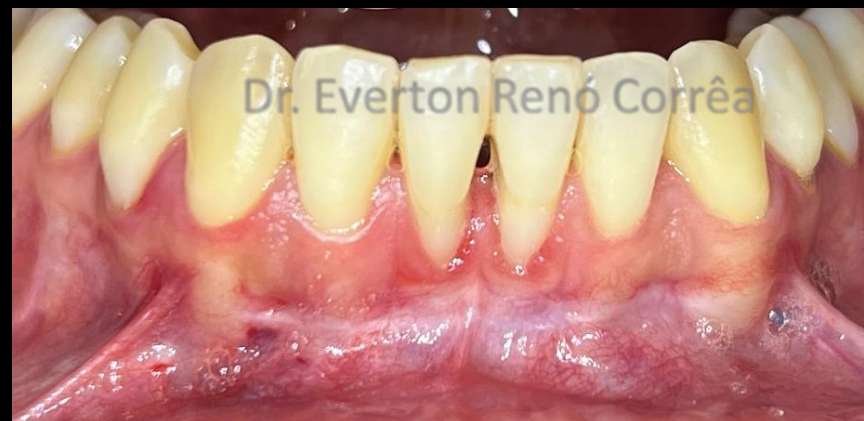
2 meses após remoção do freio labial