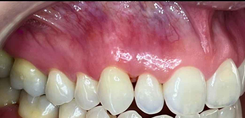
Após 2 meses do tratamento