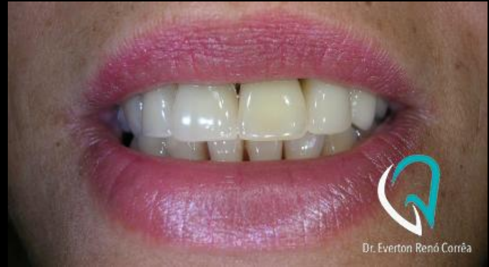
2 anos de acompanhamento