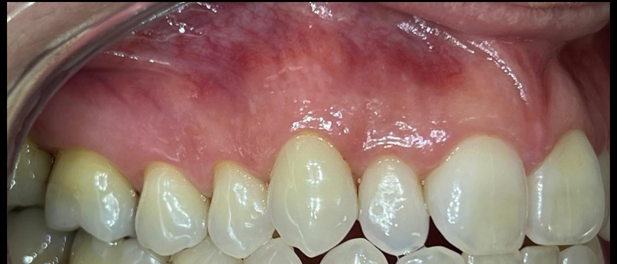
Controle após 2 anos do tratamento