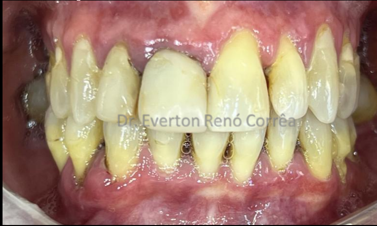
Inicial - 1ª. Sessão